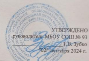
Календарный учебный график на 2024/2025 учебный год МБОУ СОШ № 93